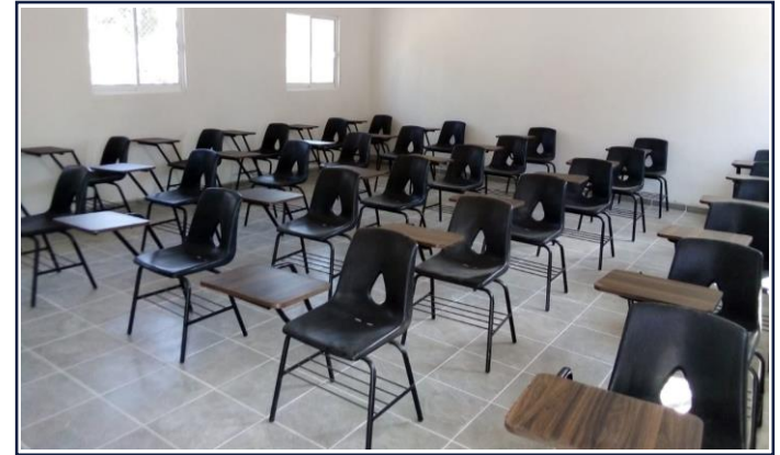
VISTA INTERIOR (AULA ESCOLAR 2)