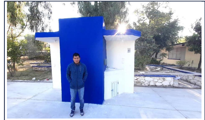
VISTA EXTERIOR ESTACION LAVADO DE MANOS