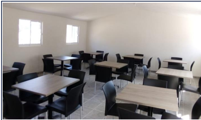
VISTA INTERIOR (COMEDOR)