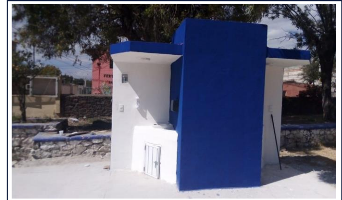
VISTA EXTERIOR ESTACION LAVADO DE MANOS