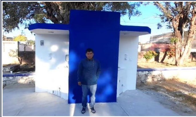
VISTA EXTERIOR ESTACION LAVADO DE MANOS