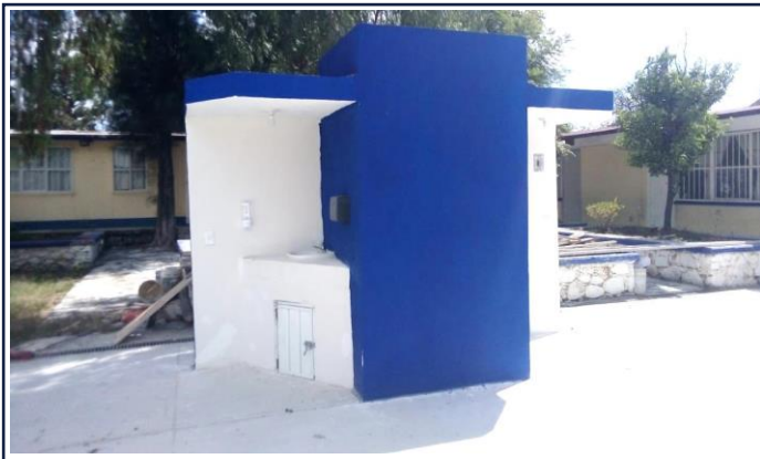
VISTA EXTERIOR ESTACION LAVADO DE MANOS